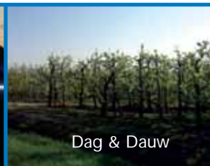
Dag & Dauw