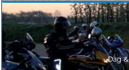
Dag & Dauw