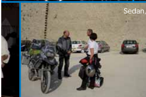
Sedan, 1 mei