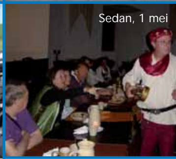
Sedan, 1 mei