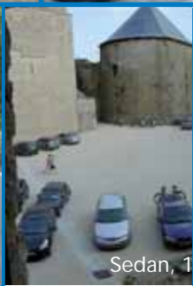
Sedan, 1 mei